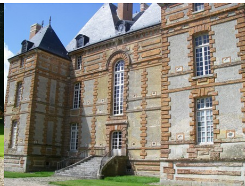
La façade est (vue proche)