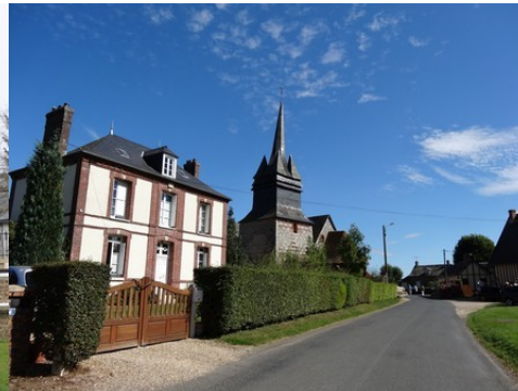
Une vue du village voisin de Beauficel