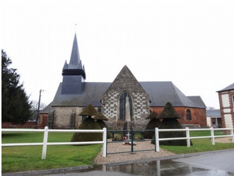
L'église de Fleury la Forêt

Les avis seront cohérents avec ceux émis ces dernières années, à savoir : pas de maisons à volume compliqué (type V, W, Y, ou Z), pentes à 45° pour les volumes principaux, ardoise ou tuile plate de teinte brun vieilli, à 20u/m 2 , avec un débord de toiture de 20cm, enduit de teinte beige clair avec modénatures (au choix : chaînages, encadrement de fenêtres, soubassement, colombage...). *Voir les autres fiches.