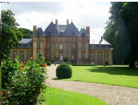
La façade ouest du château (vue proche)