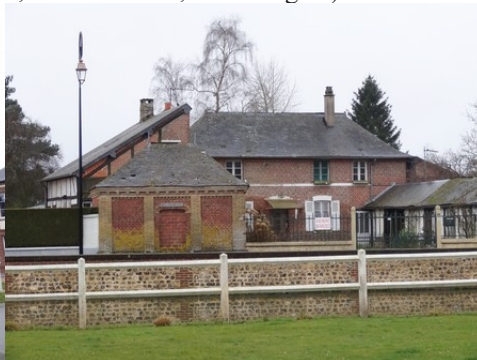
Une maison en briques de Fleury