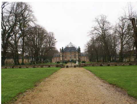
Le château vu de la grille d'honneur