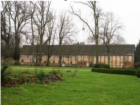
Les dépendances en bordure la cour plantée Pour la zone en rose foncé dans le périmètre de 500m