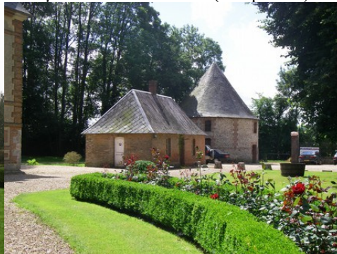
Le colombier circulaire et un pavillon