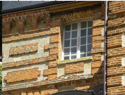
Un détail de façade du logis : briques, enduit

Il est préférable d'éviter les constructions qui viendraient au dessus de la ligne de paysage existante (maison à deux niveaux, bâtiments agricoles de type silo, château d'eau, éolienne...). Les projets éoliens ne doivent pas se trouver dans l'axe majeur du château à moins de nuire irrémédiablement à son caractère.